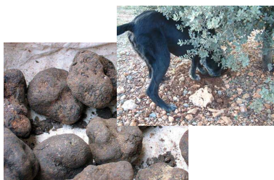
VISITA TRUFERA EN SARRIÓN