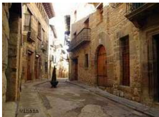
RUBIELOS DE MORA