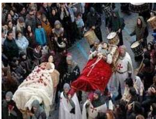
BODAS DE ISABEL DE SEGURA