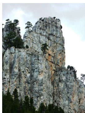
CAÑÓN DEL RÍO ALCALÁ